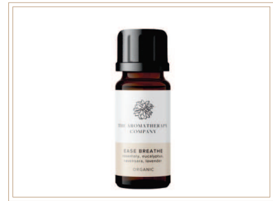
シナジーブレンド精油 イージブリーズ

ソイルアソシエーション認証ブレンド精油。ユーカリ、ローズマリー、ラベンサラ、ラベンダーブレンドで呼吸や花粉症の時期に最適です。