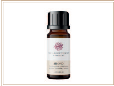
シナジーブレンド精油 ビーラッド

オーガニック認証ブレンド精油、ゼラニウム、パルマローザなどで女性らしい甘い香りのブレンドで、繊細な気持ち心地良い状態へ導きます。忙しい時、女性力アップしたい時、お部屋で焚いたり、香りを楽しんでみてください。