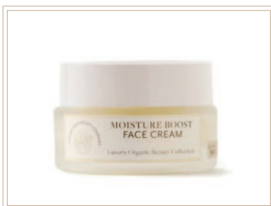
ラグジュアリー モイスチャークリーム

お肌を滑らかにし、メイクをしやすく汗や乾燥の時期に使いやすい集中保湿クリーム。「キメ」と「弾力のあるハリ」「明るさ」自信に満ちた肌へ。