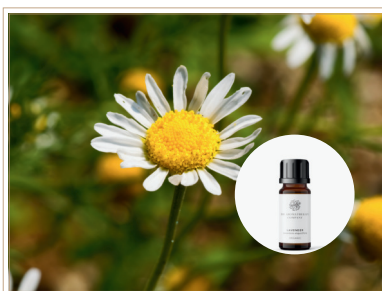
精油 カモミール・ローマン

カモミールの花から大切に抽出した、リンゴのようなフルーティで甘い香り。ゆっくりとリラックスした時にお勧めの香り。