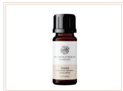
シナジーブレンド精油 ピース

ソイルアソシエーション認証ブレンド精油。イランイラン、マンダリン、シダーウッドなどでリラックスしたい時に最適です。