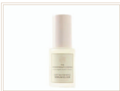
ウルチメイトリフト&ファーム ングセラム

多糖類を発酵させ、取り除いた成分。肌寿命の鍵を握る「サーチュイン遺伝子※」に着目。※修復機能を活発に活動するように導いていくと期待されている成分のひとつ。角質層に水分を長時間保てる肌に導きます。