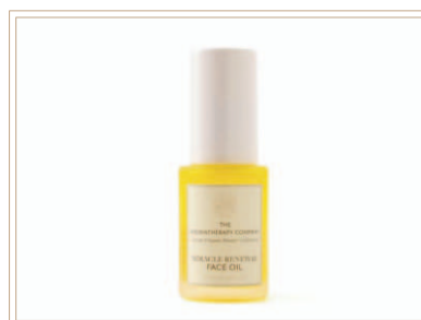
ウルチメイト ミラクル リニューアルオイル

ミラクルオイルは、お肌のすみずみ、角質層まで必要な成分を運ぶための美容導入オイル。お肌の潤いを逃さない注目成分、世界で名だたる高級オイルを厳選。