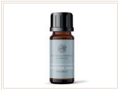
シナジーブレンド精油 ガーディアンプロテクト

ソイルアソシエーション認証ブレンド。9種類の精油をコロナ禍にブレンドして世界を駆け巡っている精油ブレンド。