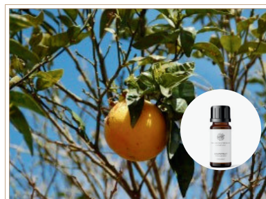
精油 グレープフルーツ

フレッシュなグレープフルーツの果皮から大切に抽出した、みずみずしいシトラスの香り。太陽の元気が必要な時にお勧めです。