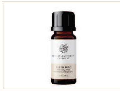
シナジーブレンド精油 クリアマインド

ソイルアソシエーション認証ブレンド精油。ローズマリー、レモン、ラベンダーブレンドでスッキリしたい時に最適です。