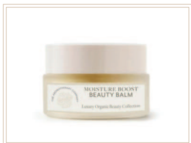
ラグジュアリー ミラクル ビューティーバーム

乾燥のダメージやエイジングサインが気になるお肌に、美容オイルがたっぷり配合されたビューティーバーム。しっかりと潤いを与えます。