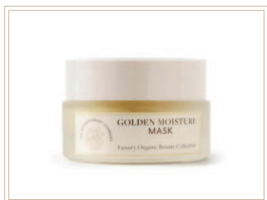
ラグジュアリー ゴールデン モイスチャーマスク

保湿・毛穴ケア・エイジングケアヘクトライト&ゴールドマイカ配合。オーガニック認証マスク。オーガニック認証成分92%、天然由来成分100%