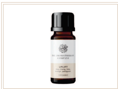
シナジーブレンド精油 アップリフト

ソイルアソシエーション認証ブレンド精油。メイチャン、ライム、オレンジ、プチグレンなどで朝起きる時や元気になりたい時に最適なブレンドです。