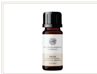
シナジーブレンド精油 リラックス

ソイルアソシエーション認証ブレンド精油。カモミール、フランキンセンス、シダーウッド、ラベンダーなどでリラックスしたい時に最適です。