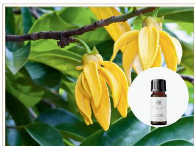
精油 イランイラン コンプリート

イランイランの花から丁寧に抽出した、甘くエキゾチックな女性らしいフローラルの香り。疲れている時、現状がマンネリ化してきている時などにお勧めの香り。