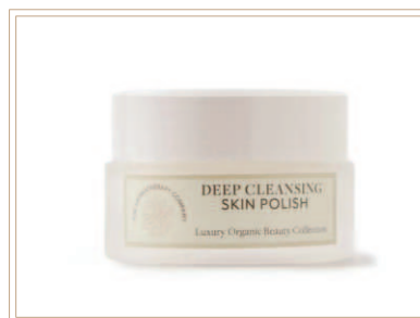
ラグジュアリー ディープ スキンポリッシュ

ナチュラルバンブーがお肌に優しくソフトタッチな微粒子のスクラブクリーム。通常角質除去が難しい部分に素早くなじんで滑らかでシルキーお肌に導きます。