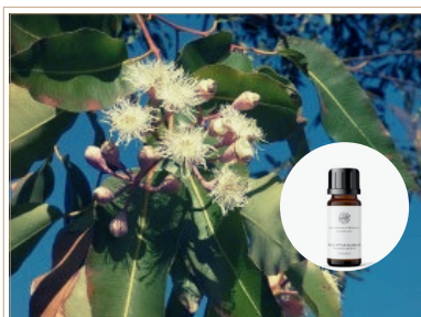
精油 ユーカリスミス

ユーカリプタスの葉から大切に抽出した、葉とカンファーの強い香り。すっきりしたい時に使うのがお勧めです。