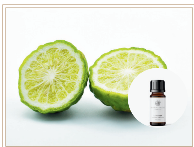
精油 ベルガモット

ベルガモットの果皮から大切に抽出した、甘いグリーンシトラス系の香り。すっきり＆フルーティ。エネルギーがマンネリ化してきている時などにお勧めの香り。