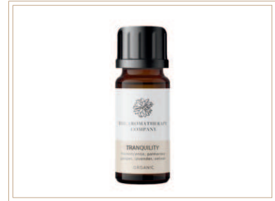
シナジーブレンド精油 トランキュアリー

ソイルアソシエーション認証ブレンド精油。グレープフルーツ、ペチパー、パチュリ、ラベンダーなどでリラックスしたい時に最適です。