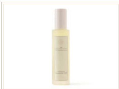
ラグジュアリー クレンジングウォッシュ

きめ細かい泡で摩擦による刺激を軽減します。すすぎ後のぬるつきやベタつきもありません。お肌の古い角質や皮脂の汚れを落とします。