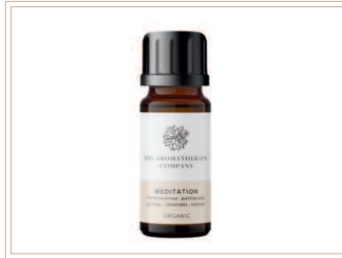
シナジーブレンド精油 メディテーション

ソイルアソシエーション認証ブレンド精油。フランキンセンス、ペチパーが心を地につけてくれるような、あたたかいブレンド。深呼吸を誘うような香りが「自分の時間」を再現してリラックスさせるメディテーション空間を作り上げます。