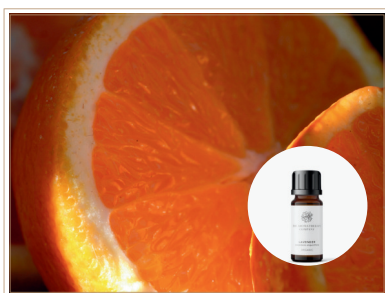
精油 オレンジスイート

輝く太陽の下で育ったオレンジの果皮から大切に抽出した、甘くフルーティな香り誰にでも好まれる甘い香り。緊張や不安を抱えた気分を楽にして、前向きで自信のある状態に。